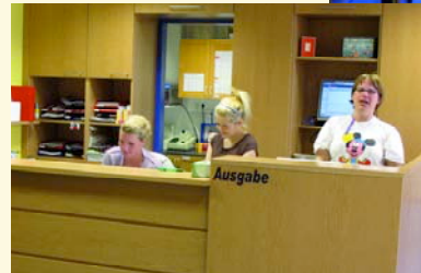
Das nette Praxisteam