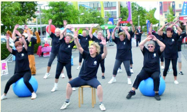
Seniorengruppe "TSV Berlin Wittenau" in Aktion

Freuen Sie sich auf ein tolles Sportprogramm auf unserer Bühne und lassen Sie sich