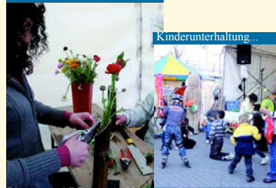
Blumen und Pflanzen in Hülle und Fülle.