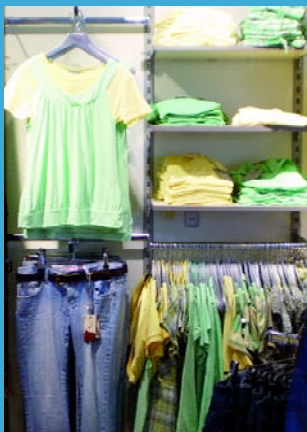
Trends dieser Saison

Dazu trägt Frau schmale Jeans und Jeggings (Mix aus Jeans und Leggings). Femininer Gegenpol dazu ist der Romantik-Look, der mit verspielten Blusen und voluminösen Shirts daher kommt. Blümchendrucke, Smog-Elemente und Raffungen setzen dabei besonders dekorative Akzente. Natürlich dürfen die passenden Accessoires nicht fehlen. Von kariert bis geblümt, von transparent bis knallbunt – Tücher und Schals sind "Must Haves" für jede modebegeisterte Frau.