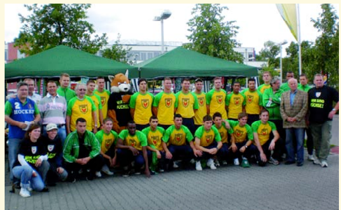
Fußball-Oberliga-Mannschaft der Reinickendorfer Füchse

zum Mitmachen animieren. DJ Frankie wird Ihnen "einheizen", Sie durch das Programm führen und den jeweiligen Sportverein vorstellen. Lassen Sie sich diese Bühnenshow nicht entgehen, denn hier werden sowohl traditionelle als auch Trendsportarten für die ganze Familie präsentiert. Sollten dabei Fragen oder der Wunsch nach einem persönlichen Beratungsgespräch aufkommen, stehen Ihnen die Mitarbeiter des jeweiligen Sportvereins an ihren Ständen gerne mit Rat und Tat zur Seite. Gern können Sie sich Informationsmaterial mit nach Hause nehmen oder ggf. ein Probetraining vereinbaren.